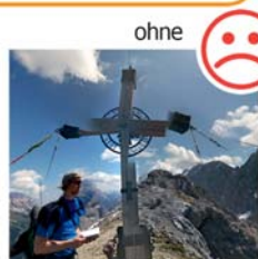
"Hinterer Tajakopf" 2408m